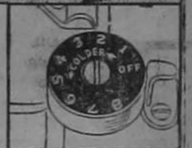
Temperature regulator speeds freezing