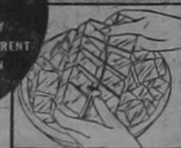
Plenty of ice cubes with Electrolux